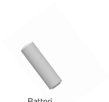
Batteri 3,6V ER 14505