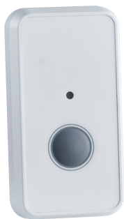
Detect Door Pro trådløs dørklokke