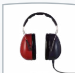
LL-Kopfhörer DD65 v2