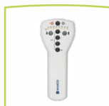
MA 1 Gerät